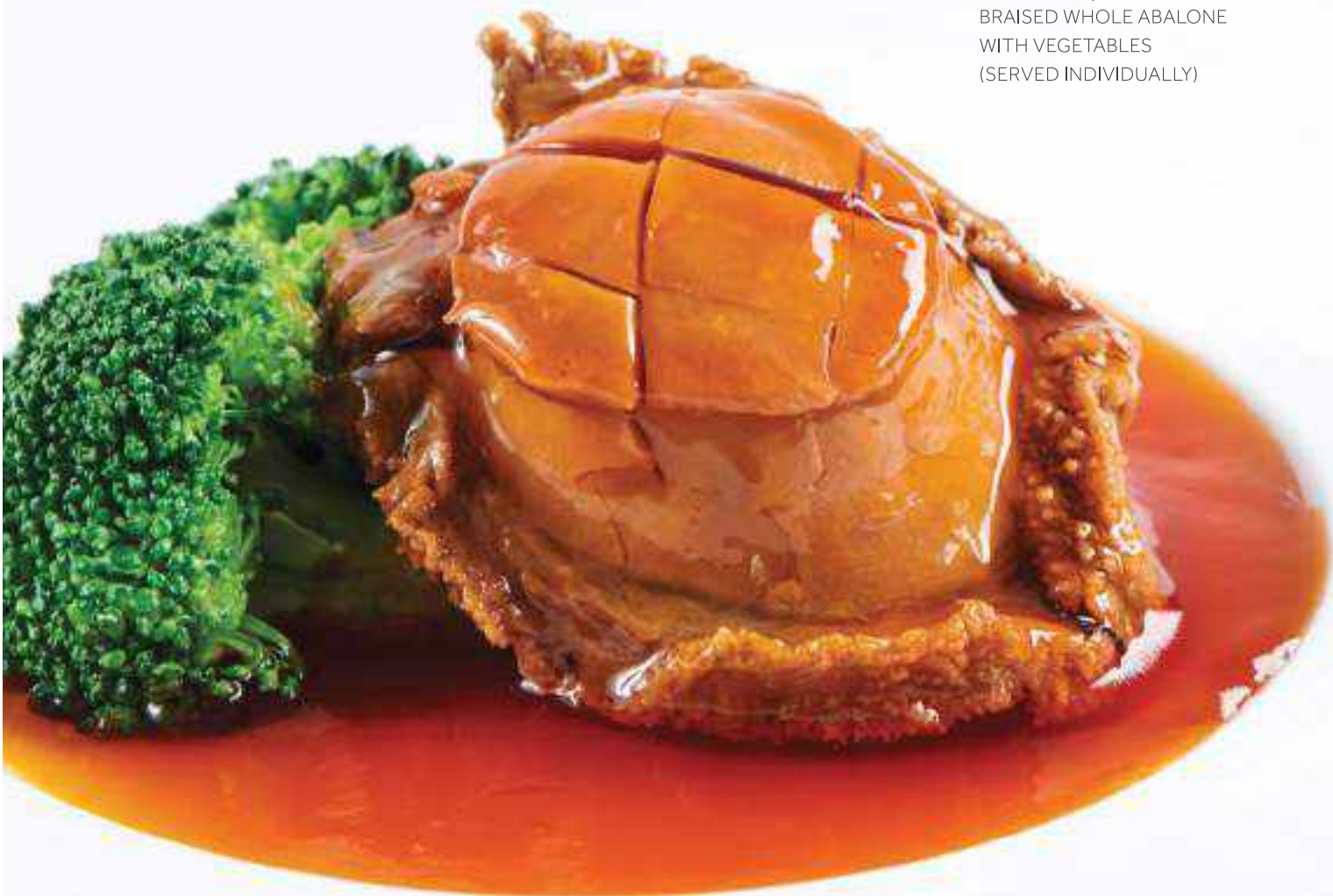
蠔皇三頭鮮鮑 เป่าอ้อกั้งตัวตุนน้ำแดง BRAISED WHOLE ABALONE WITH VEGETABLES (SERVED INDIVIDUALLY)